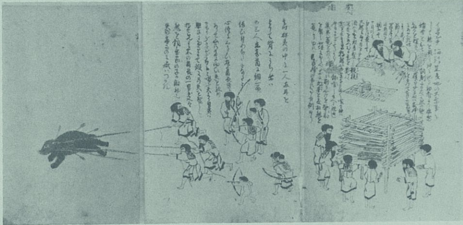
「 え 蝦夷 ぞ 島 しま 奇 き 観 かん 」より 寛政10年(1798)

Bulletin of the Hokkai Gakuen University Library